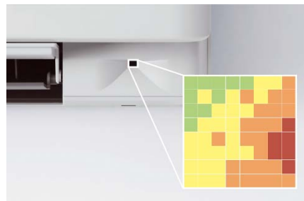
Mřížkový optický snímač rozdělí místnost mřížkou o 64 čtvercových polích a měří povrchovou teplotu v každém z těchto polí.

Po zjištění aktuální teploty v místnosti mřížkový optický snímač nejprve směřuje vzduch rovnoměrně do celé místnosti a poté přepne rozložení vzduchových proudů tak, aby se ohřívaly nebo ochlazovaly ty zóny, které to potřebují nejvíc.